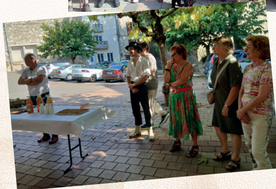
• Remise des récompenses du concours de dessin aux enfants