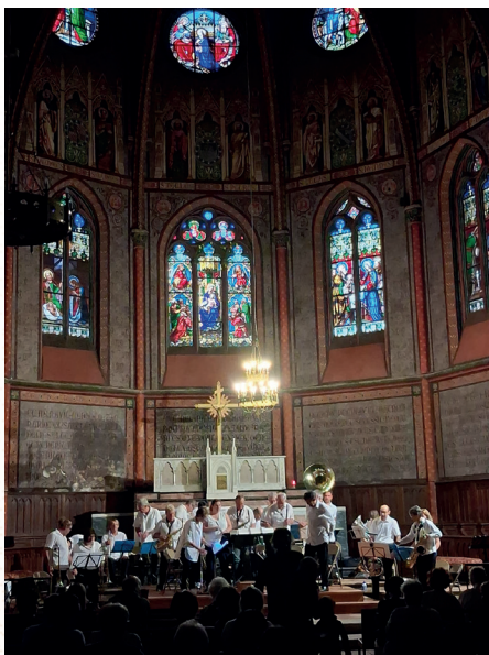
• Orchestre d'Harmonie de Nérac