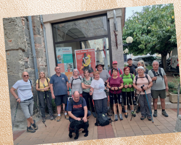
• Avec les Doux Dingues