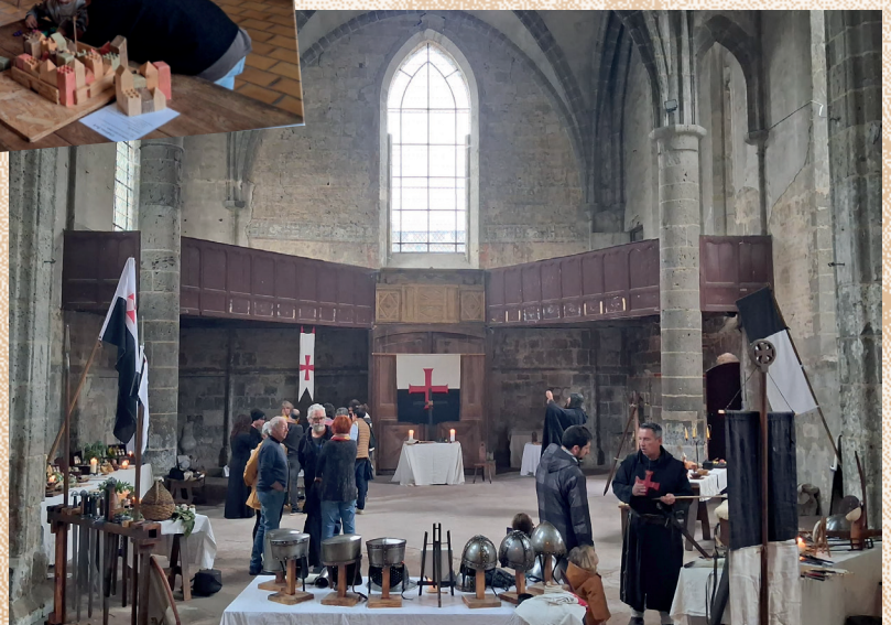
• Association des Frères du Feu Sacré