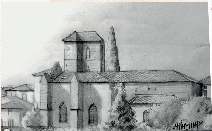
• Dessin de Melh