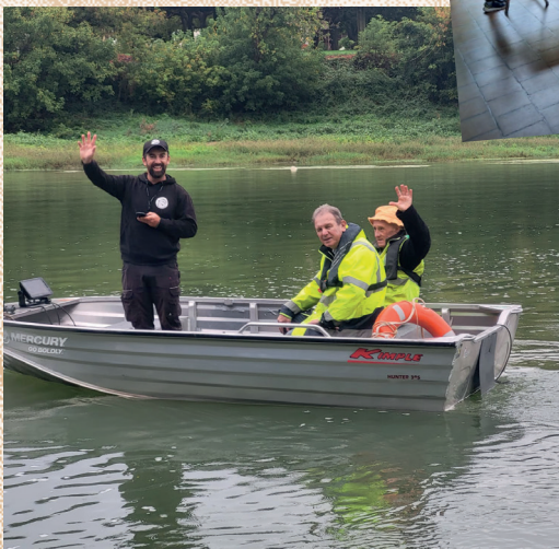
• Sur Garonne, patrimoine vivant avec les pêcheurs Portais