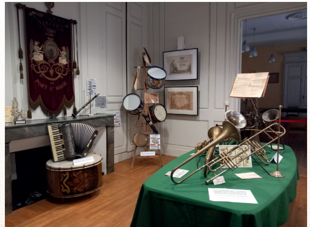
• Exposition Orphéons