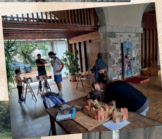
• Jeux anciens en bois de la compagnie des Tours