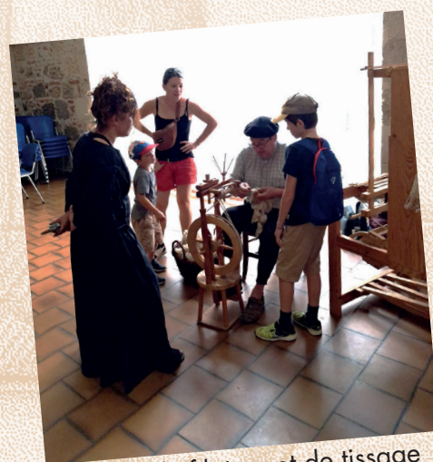
• Atelier de filature et de tissage