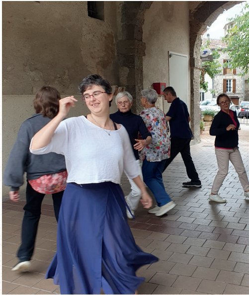
• Atelier de danses traditionnelles